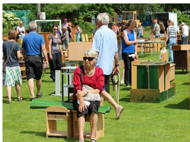
Varför stressa när man kan "chilla".