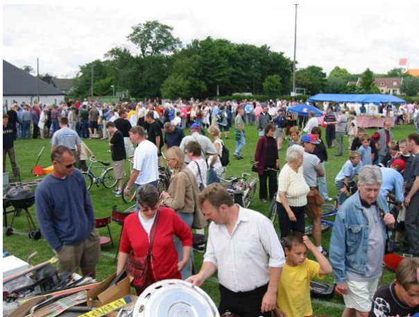
Kanske man hittar ett riktigt FYND!.