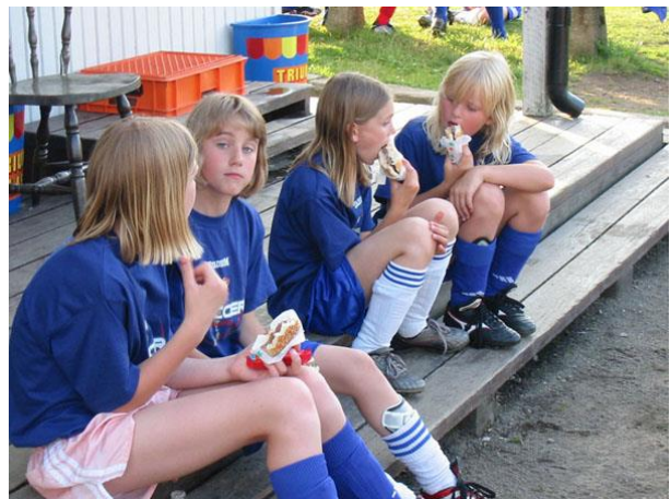
Kiosken öppnar kl. 12:00.