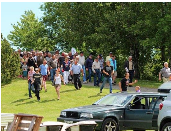
Insläpp kl 13:00.